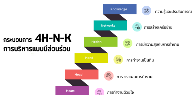
ภาพที่ 1 กระบวนการการบริหารแบบมีส่วนร่วม 4HNK